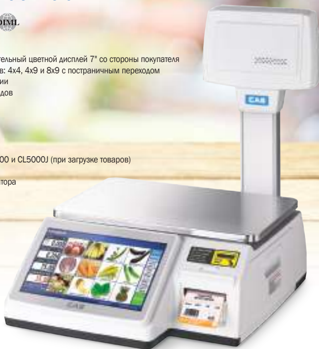
Весы с сенсорным дисплеем в стандартном исполнении