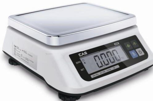
Рисунок 1 - Общий вид весов

Общий вид весов представлен на рисунке 1.