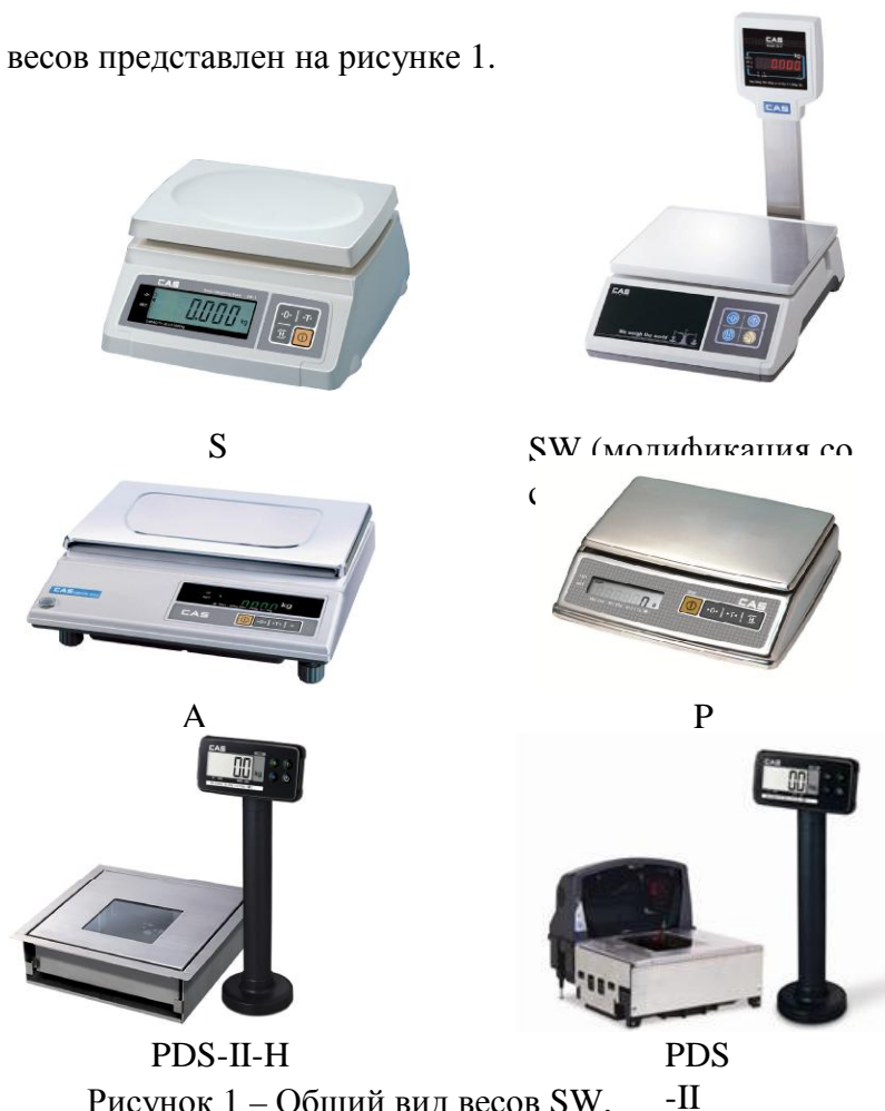
Рисунок 1 – Общий вид весов SW, PW, AD, PDS-II

Общий вид весов представлен на рисунке 1.