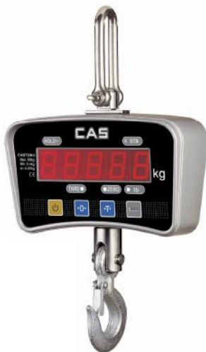
Весы Caston-I (ТНА) (MAX=0.5 т)