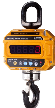
Весы Caston-III (ТНД)