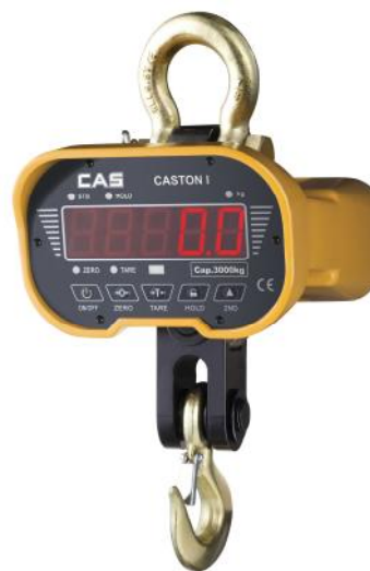
Весы Caston-I (ТНА) (MAX=1, 2, 3, 5 т)