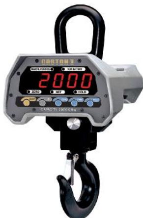
Весы Caston-II (ТНВ)